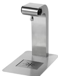
Einzelausgabe-Hahn mit zwei Bedienknöpfen am Auslass