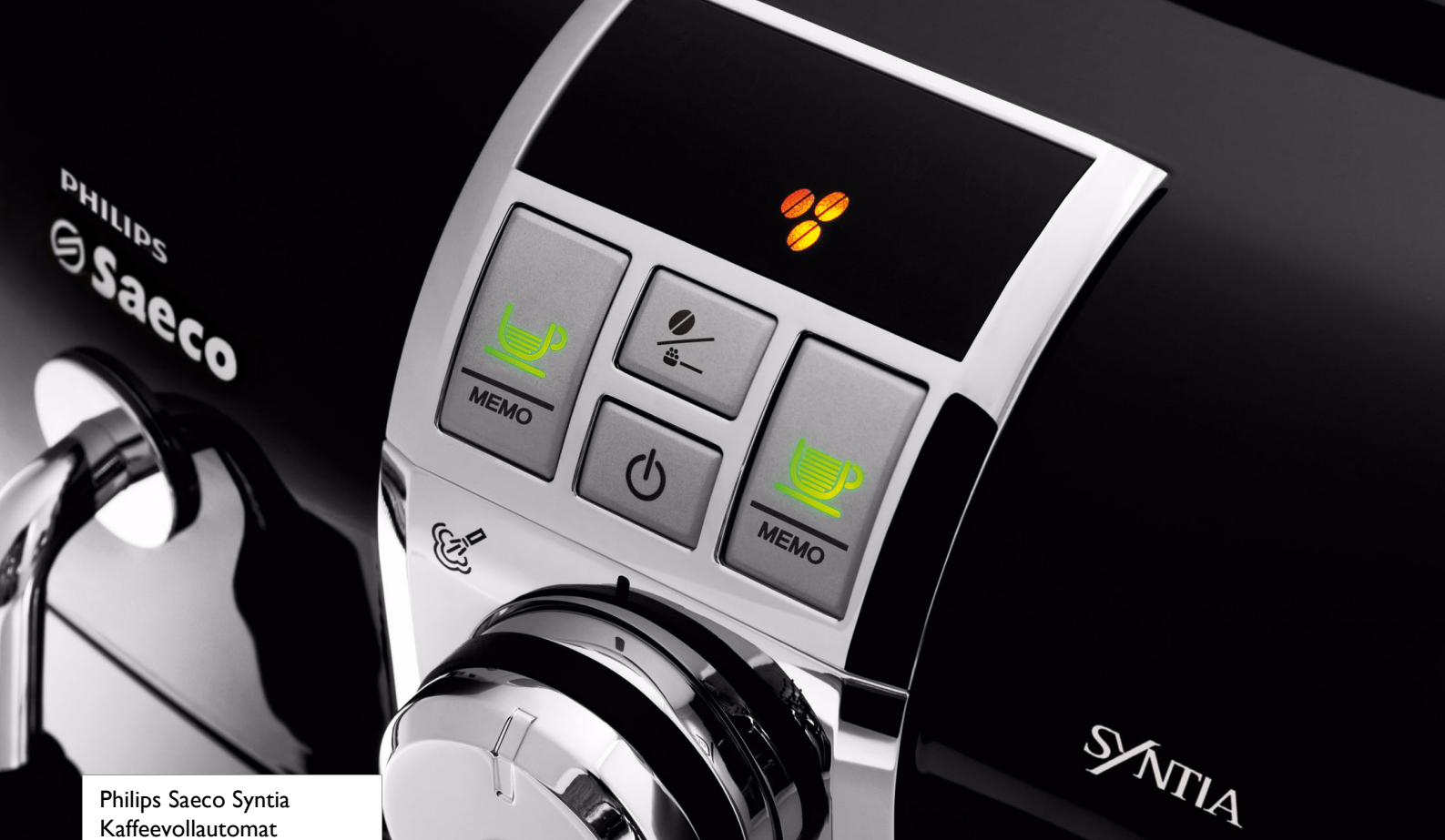
Philips Saeco Syntia Kaffeevollautomat